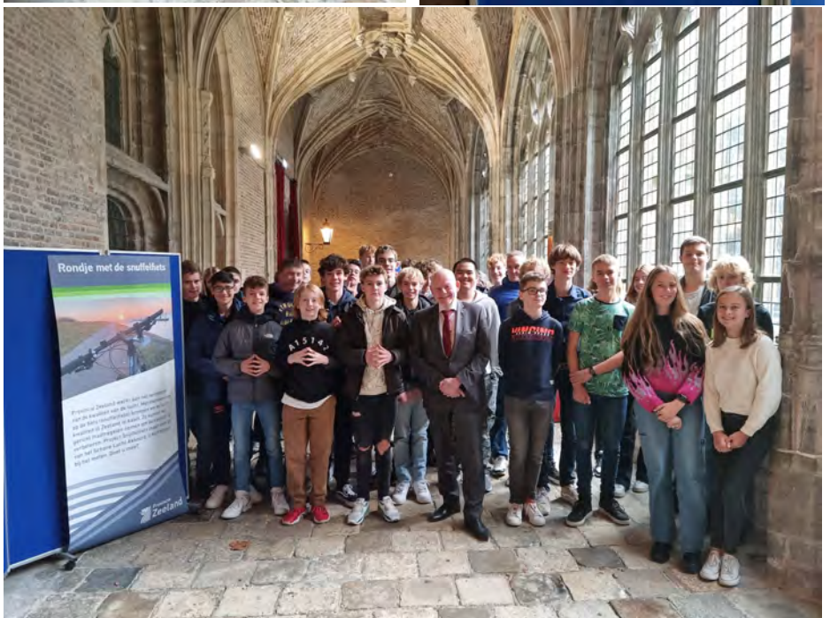
Hoe schoon is de lucht in Zeeland? Onze technasiumleerlingen (klas 3) presenteerden op dinsdag 22 november hun onderzoeksresultaten aan de Provincie Zeeland en gedeputeerde Dick van der Velde in de kloostergangen van de Abdij. Er werd druk gesproken over luchtvervuiling, fijnstof en hoe we samen de luchtkwaliteit kunnen verbeteren. Behalve Nehalennia deden ook technasiumleerlingen van het Goese Lyceum, Pieter Zeeman (Zierikzee) en het Lodewijkcollege (Terneuzen) mee aan het project.