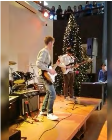
Show your talent: open podium tijdens de middagpauzes van 19, 20 en 21 december