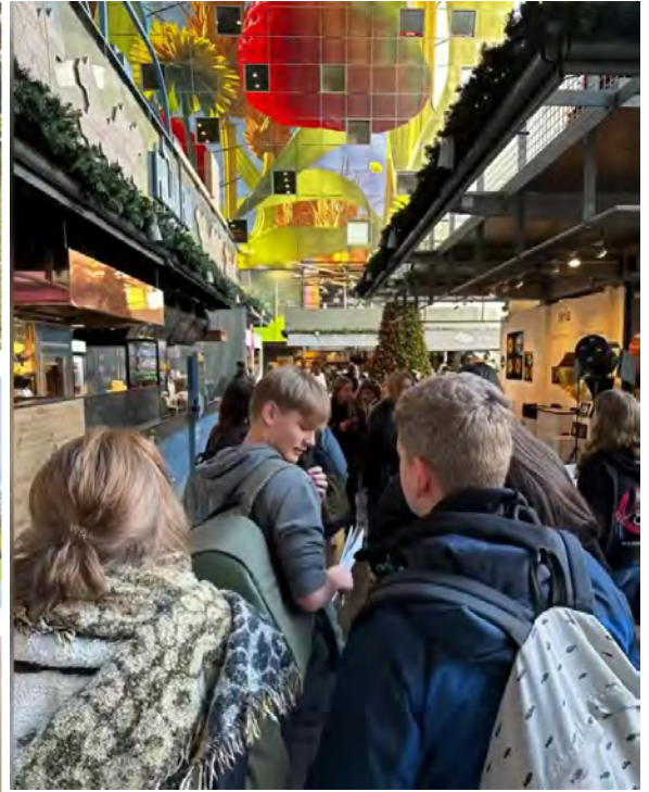
Excursie klas 2 en 3 Kunst en Cultuur Rotterdam

In het kader van de lessen War Poetry reisde V6 op 10 november af naar de Westhoek. Een indrukwekkende dag met oa bezoek aan Brothers in Arms, The Brooding Soldier, Memorial Museum Passchendaele