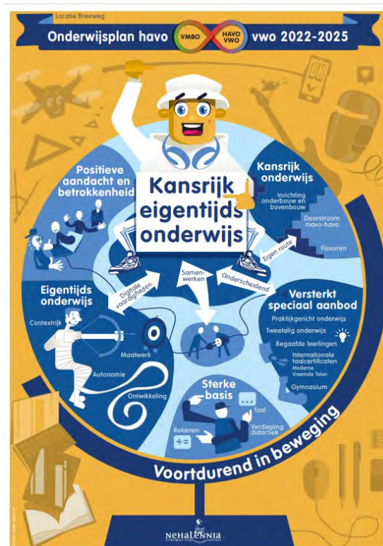
De posterweergave van ons onderwijsplan