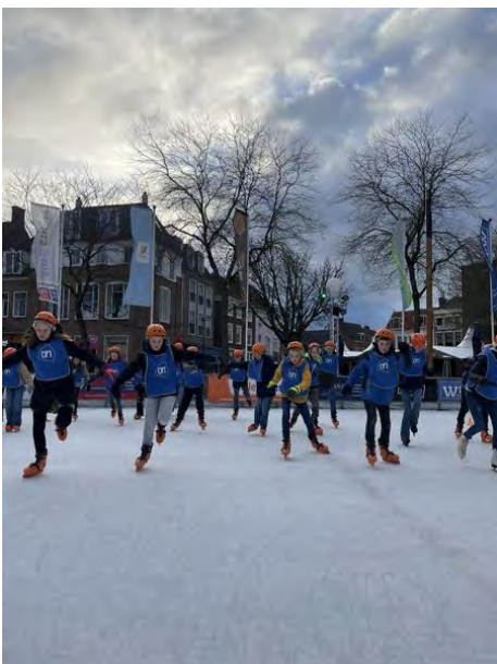
Schaatsen klas 1 (10 januari)